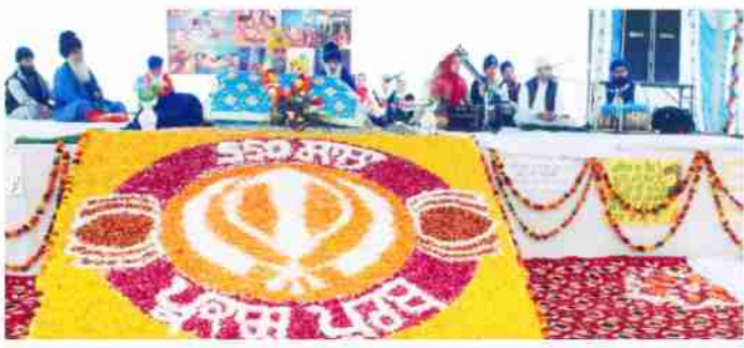
ਸ੍ਰੀ ਗੁਰੂ ਨਾਨਕ ਦੇਵ ਜੀ ਦੇ 550 ਵੇਂ ਪ੍ਰਕਾਸ਼ ਪੁਰਬ ਨੂੰ ਸਮਰਪਿਤ ਕਰਵਾਏ ਗਏ ਗੁਰਮਤਿ ਸਮਾਗਮ ਦੌਰਾਨ ਸ਼ਬਦ ਕੀਰਤਨ ਕਰਦੀਆਂ ਕਾਲਜ ਵਿਦਿਆਰਥਣਾਂ।