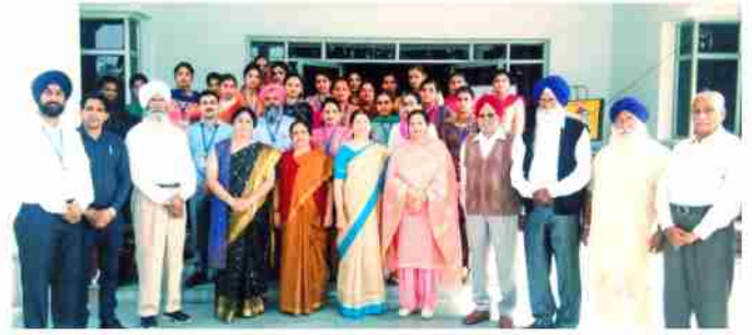
ਕਾਲਜ ਵਿੱਖੇ ਕਰਵਾਈ ਗਈ ਨੈਕ ਟੀਮ ਦੀ ਫੇਰੀ ਦੌਰਾਨ ਨੈਕ ਕਮੇਟੀ ਦੇ ਮੈਂਬਰਜ਼, ਕਾਲਜ ਪ੍ਰਬੰਧਕੀ ਕਮੇਟੀ ਮੈਂਬਰਜ਼, ਪ੍ਰਿੰਸੀਪਲ ਅਤੇ ਸਮੂਹ ਸਟਾਫ਼।